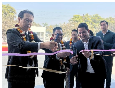
テープカットを行う合弁各社の役員

BEI と EBWS は、今後も高品質なワイヤーハーネスの提供を通じ、グローバルに製造業の発展に貢献してまいります。