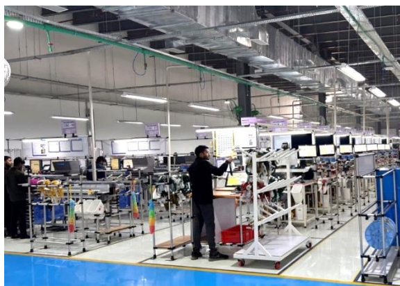
ノイダ工場 生産ライン

開所式には合弁各社の役員が出席し、テープカットを行ったほか、EBWS のさらなる発展と末永い成長を祈念して、植樹を行いました。