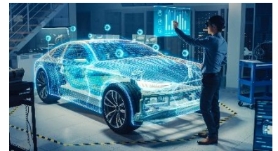
② 試作前に結果を予測：REGALIS Fusion