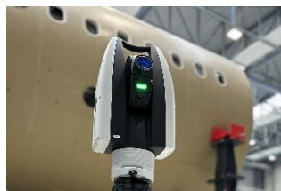
⑥ 自律移動ロボットによる無人計測：Leica Absolute Tracker ATS800+AMR