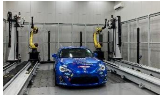
TTS 厚木テクニカルセンターの様子

東京貿易テクノシステム株式会社（TTS）は、三次元測定機やレーザートラッカーなどの高精度な計測機器を提供し、製造業のスマートマニュファクチャリングを支援する企業です。主な事業は、計測機器の販売・技術サポート・ソフトウェア開発・エンジニアリングサービスで、自動車業界、建築業界、鉄鋼業界などの大手メーカーから航空宇宙、重工業、研究機関まで、ものづくりの現場における製品の設計、品質管理、製造プロセスの最適化を支援しています。